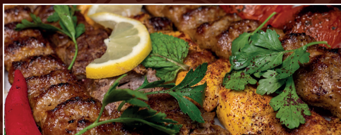
57. Grillteller für 3 Personen D 61,90 € 1 Barg, 1 Barreh, 1 Djudje, 2 Kubideh dazu Grilltomaten dazu 3 Portionen Reis mit Safran und Kräuterbeilage