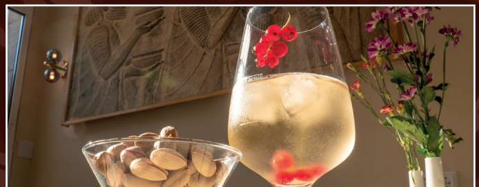
Weißwein grauburgunder mit Pistazien