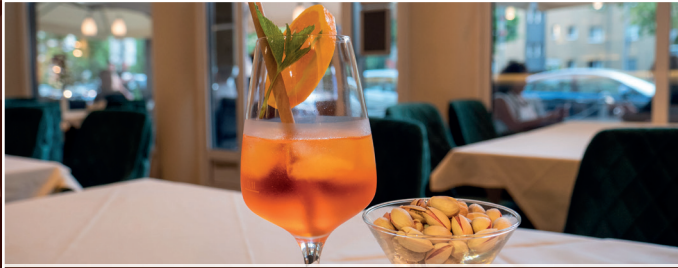
Aperol gespritzt mit Pistazien