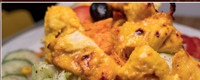
18. Hähnchen Salat 13,90 € Salat der Saison mit gegrillter Hähnchenbrust