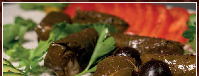
26. Dollmeh 8,90 € pikante Weinblätter gefüllt mit Duftreis