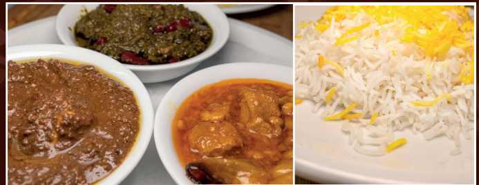
41. Bunter Teller 23,90 € drei verschiedene „Khoescht“ nach Wahl dazu Reis und Kräuterbeilage