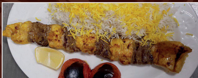
52. Chelo Kabab Bakhtiari D 15,90 € Lammrücken- & Hähnchenfleischspieß, dazu Reis mit Safran und frische Kräuter als Beilage