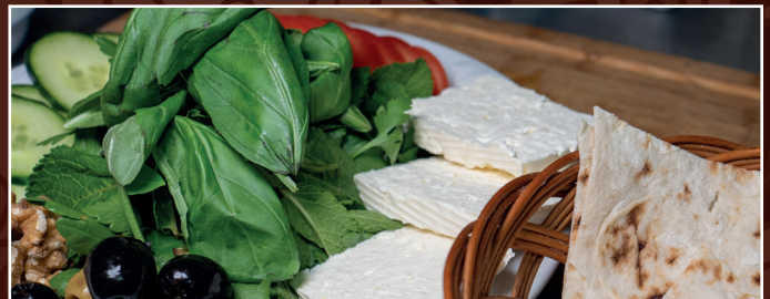
13. Sabsi Panir 7,00 € frische Kräuter mit Käse und Walnüsse