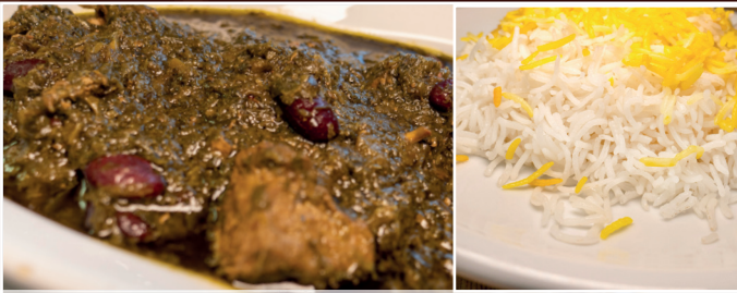
37. Ghorme sabzi 14,90 € geschnitztes Kalbfleisch, gebratene Auberginen, in Tomatensoße, dazu Reis und Kräuterbeilage