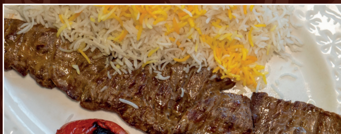
51. Chelo Kabab Barg 16,90 € zartes Lammfilet, gegrillte Tomaten dazu Reis mit Safran und frische Kräuter als Beilage