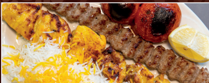
49. Chelo Kabab Djudje Soltani 19,90 € Lammhackspieß und Hähnchenfleischspieß vom Grill, gegrillte Tomaten dazu Reis mit Safran und frische Kräuter als Beilage