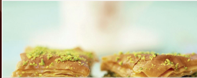
66. Baghlava C 6,00 € Honigsüßigkeit mit Pistazien im Ofen gebacken