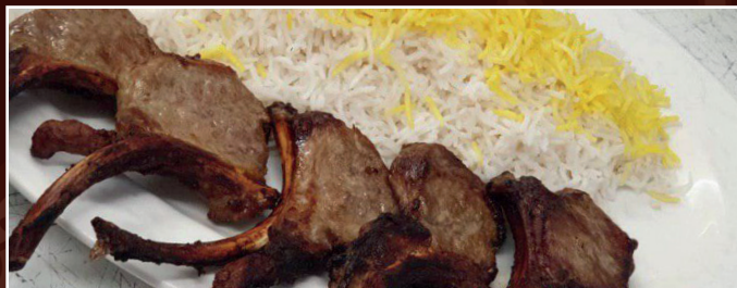
50. Lammkotlett 24,90 € Lammkotlettspieß vom Grill, gegrillte Tomaten, dazu Reis mit Safran und frische Kräuter als Beilage