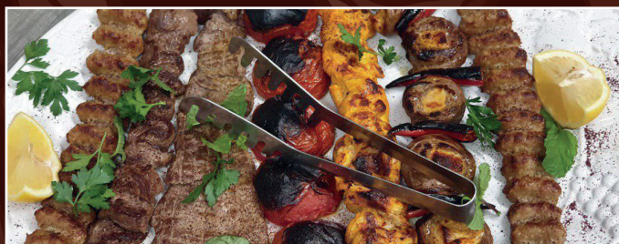
58. Grillteller für 4 Personen D 68,90 € 1 Bolghari, 1 Barg, 1 Barreh, 1 Djudje, 2 Kubideh dazu Grilltomaten, dazu 4 Portionen Reis mit Safran und Kräuterbeilage