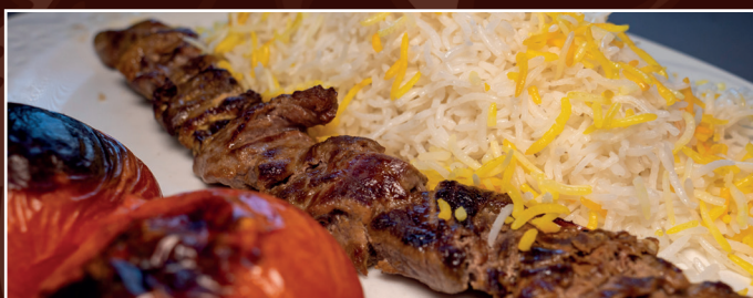
54. Chelo Kabab Barreh D 16,90 € Lammrückenspieß ohne Knochen, gegrillte Tomaten, dazu Reis mit Safran und frische Kräuter als Beilage