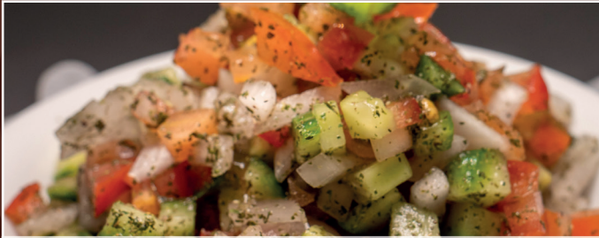
14. Salat Schirasi 6,90 € Tomaten, Gurken, Zwiebeln, Olivenöl und Zitronensaft