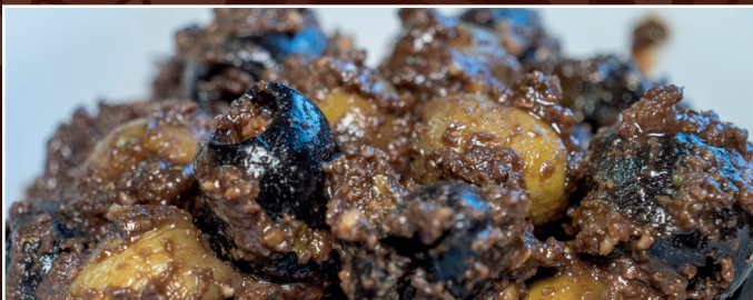
12. Seytun Parvarde 6,90 € marinierte Oliven mit Granatapfelmark und Walnüsse