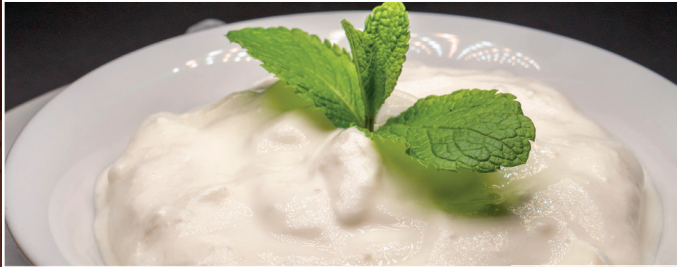
06. Mast'o Musir 4,80 € frischer Joghurt eingereichert mit wilder Knoblauch