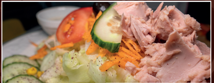
17. Thunfisch Salat 12,90 € Salat der Saison mit Thunfisch