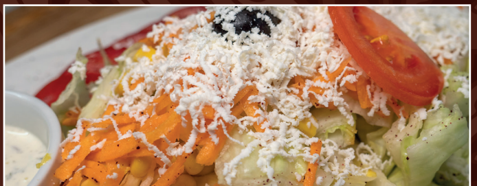
19. Salat mit Käse 12,90 €