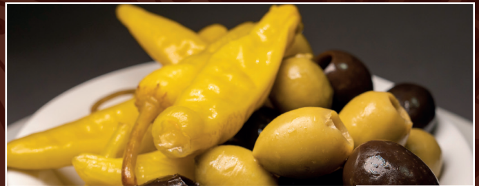
11. Felfel Torschi 4,80 € eingelegte Oliven und Peperoni