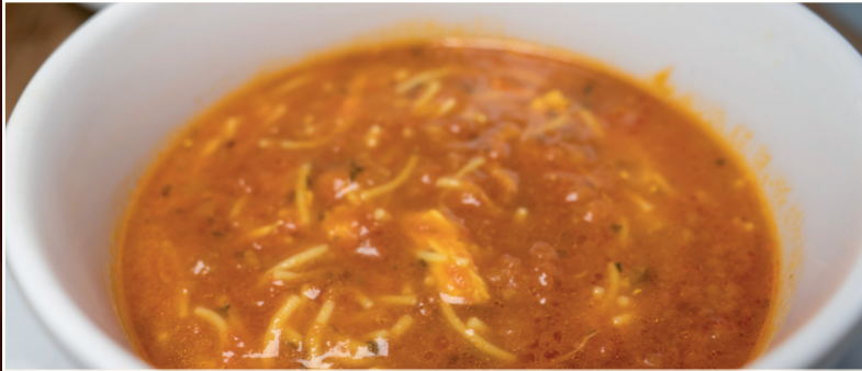
01. Suppe Morgh 6,90 € persische Hünersuppe