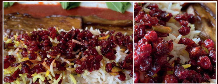
42. Zereschk-Polo (vegetarisch) 12,90 € gebratene Auberginen in Tomatensoße mit Berberitzen dazu Reis und Kräuterbeilage