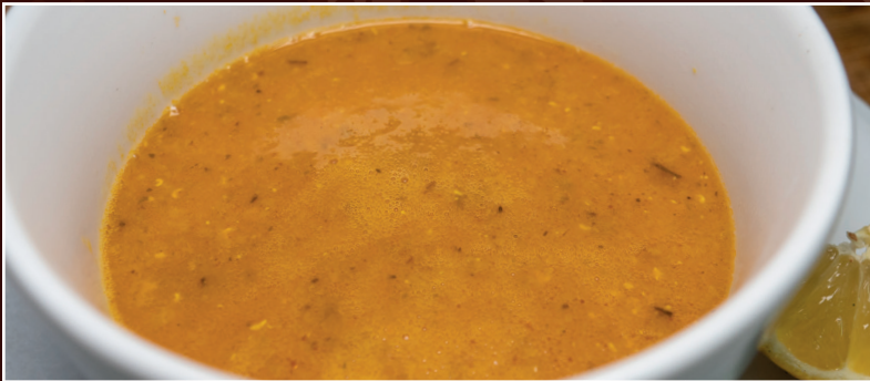
02. Suppe Adas 6,90 € persische Linsensuppe