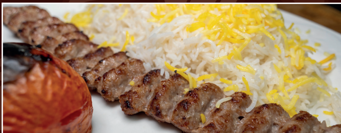
46. Mini Kabab Kubideh 9,90 € Lammhackspieß vom Grill, gegrillte Tomate dazu Reis mit Safran und frische Kräuter als Beilage