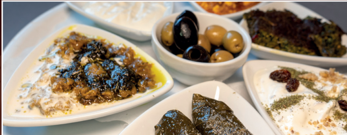
20. Vorspeisenteller für 2 Personen 17,90 € Bunter Teller mit verschiedenen vegetarischen Vorspeisen + Brot