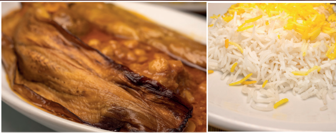
36. Gheymeh Bademdjan 13,90 € geschnitztes Kalbfleisch, gebratene Auberginen, in Tomatensoße, dazu Reis und Kräuterbeilage