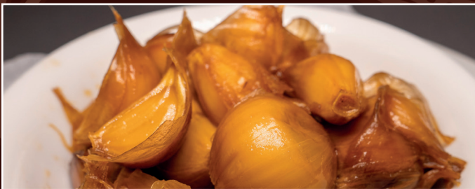
10. Sir Torschi 4,80 € eingelegte Knoblauch