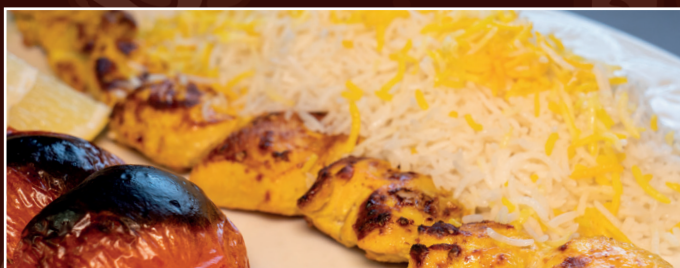
55. Djudje Kabab D 14,90 € Hähnchenfleischspieß vom Grill, gegrillte Tomaten, dazu Reis mit Safran und frische Kräuter als Beilage