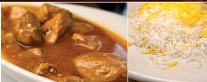
38. Bamyeh 15,90 € geschnitztes Kalbfleisch mit Okraschoten in Tomatensoße, dazu Reis und Kräuterbeilage