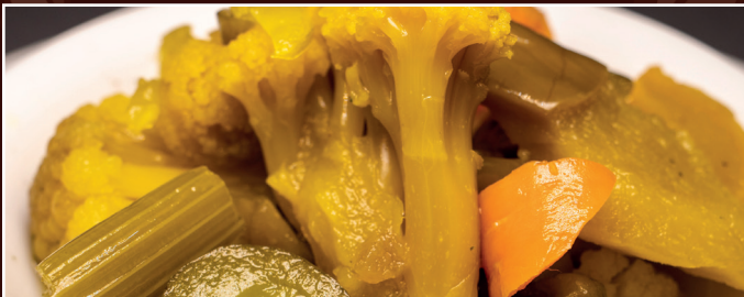
08. Torschi Makhlut 4,80 € gemischte eingelegte Gemüse