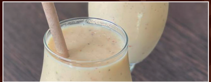
Shake mit Milch und Bananen und pers. Eis & Nuss