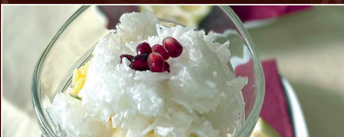
Faludeh Ein Gemisch aus Glasnudeleis und Obst