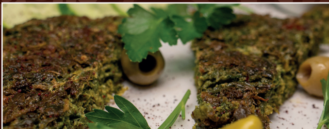
25. Kuku Sabzi A, C 10,90 € Kräuter-Kuchen