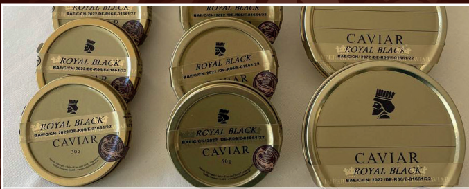
Persischer Kaviar 30 g / 50g / 100g