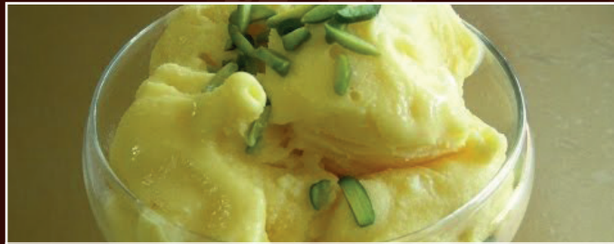
67. Bastani C, D 6,00 € persisches Eis mit Safran, Pistazien und Rosenwasser