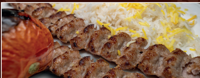
47. Chelo Kabab Kubideh 13,90 € 2 Lammhackspieß vom Grill, gegrillte Tomaten dazu Reis mit Safran und frische Kräuter als Beilage