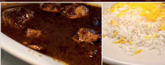
39. Fessendjan C 16,90 € Hähnchenfleischstücke mit gebackene Walnüssen in feiner persischer Granatapfelsoße, dazu Reis und Kräuterbeilage