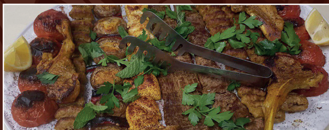
59. Grillteller für 5 Personen D 89,90 € 1 Bolghari, 1 Lammkotlett, 1 Barg, 1 Barreh, 1 Djudje, 3 Kubideh dazu Grilltomaten, dazu 5 Portionen Reis und Kräuterbeilage