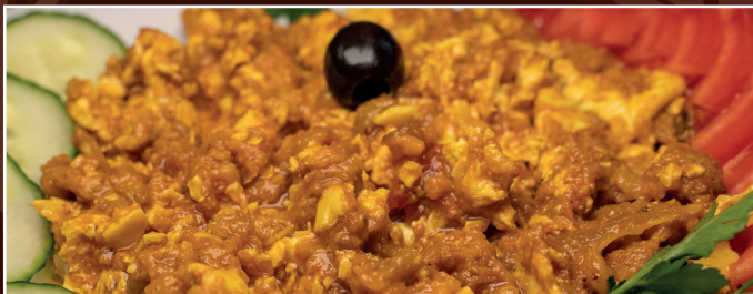
23. Mirza Ghassemi A 8,90 € gegrillte Auberginen, Tomaten, Eier und Knoblauch