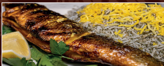
33. Wolfsbarsch B 24,90 € Wolfsbarsch mit Kräuterreis und gemischter Salat