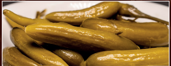
09. Khair Schur 4,80 € eingelegte saure Gurken