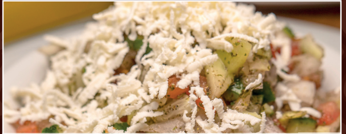
15. Salat Schirasi ba Panir D 7,90 € Tomaten, Gurken, Zwiebeln, Olivenöl, Zitronensaft & Käse