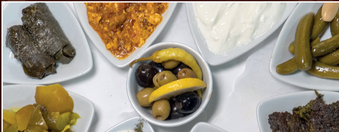
21. Vorspeisenteller für 4 Personen 26,90 €