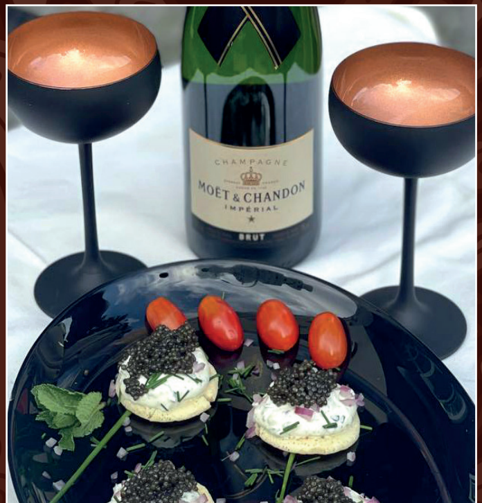
Kaviar mit Champagner 30 g. exklusiver persischer Kaviar auf Blinis Nach Wahl mit Frischkäse, Kräutern und feinen zwiebeln / ohne Frischkäse auf Blinis