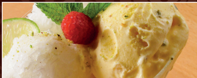
69. Makhlut C, D 7,00 € Ein Gemisch aus Eis und Faludeh