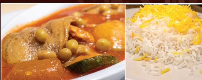
40. Kadu Bademdjan 16,90 € geschnitztes Kalbfleisch mit Zucchini, Auberginen in getrocknete Pflaumen, Tomaten, Safransoße, dazu Reis und Kräuterbeilage