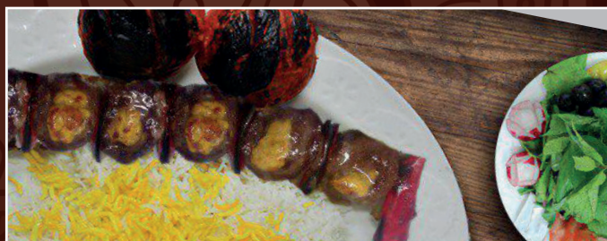
53. Chelo Kabab Bolghari 17,90 € gegrillte Lammfiletstreifen mit Peperoni, dazu Safran-Reis, Grilltomaten und frische Kräuter als Beilage