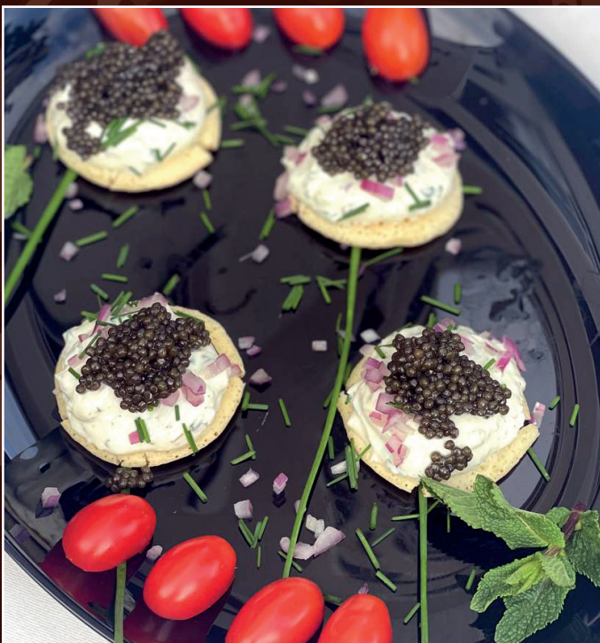
Kaviar 30 g. exklusiver persischer Kaviar auf Blinis Nach Wahl mit Frischkäse, Kräutern und feinen zwiebeln / ohne Frischkäse auf Blinis