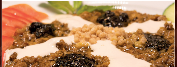
22. Kaschke Bademdjan C, D 8,90 € gebratene Auberginen, Molke, verfeinert mit gebratene Minzen