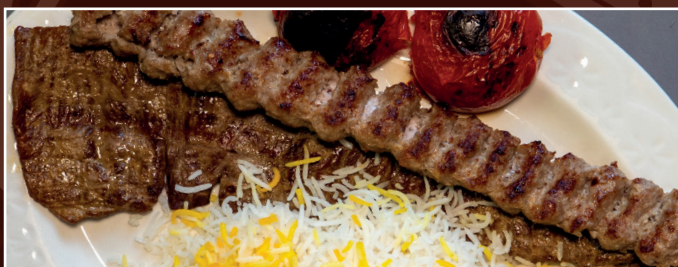
48. Chelo Kabab Soltani 21,90 € Lammfiletspieß und Lammhackspieß vom Grill, gegrillte Tomaten dazu Reis mit Safran und frische Kräuter als Beilage