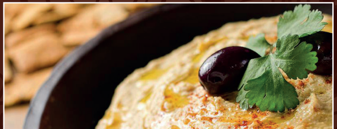
27. Hommus 8,90 € Kichererbsenpüree mit Sesamsoße, Knoblauch, Zitronensaft