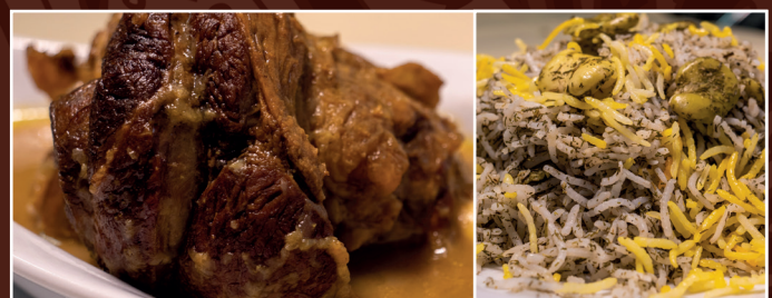
44. Baghali-Polo ba Mahitsche 18,90 € gebratener Lammhaxe mit Safran-Dillreis und dicke Bohnen