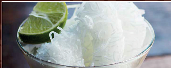
68. Faludeh 6,00 € persisches Glasnudeln mit Rosenwasser und Limettensaft