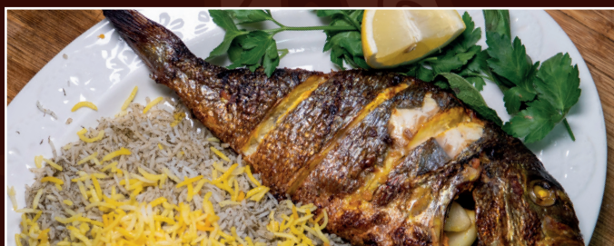
32. Dorade B 21,90 € Dorade mit kräuterreis und gemischter Salat