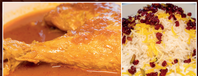
43. Zereschk-Polo ba Morgh 13,90 € Hähnchenfleisch in Tomatensoße mit gebratene Berberitzen dazu Reis und Kräuterbeilage