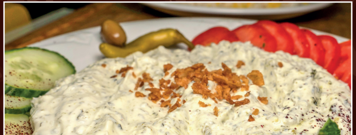
24. Borani Esfandj D 8,20 € frischer Joghurt mit gebr. Spinat