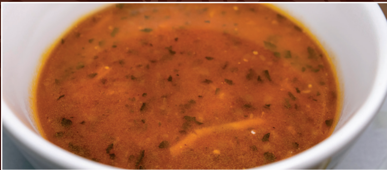
03. Suppe Djo 6,90 € persische Gerstencremesuppe