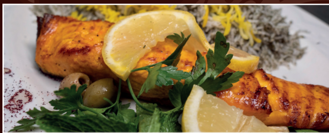
31. Lachs B 19,90 € zartes Lachsfilet mit Kräuterreis und gemischter Salat