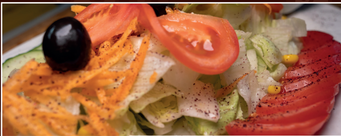
16. Gemischter Salat 8,90 € gemischter Salat der Saison