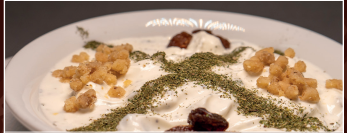
07. Mast'o Khair 4,80 € frischer Joghurt, Gurken und Minze