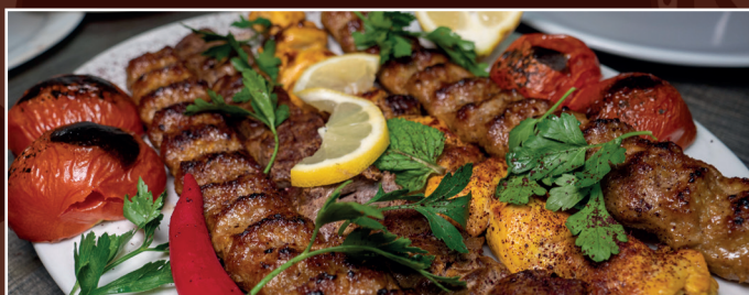
56. Grillteller für 2 Personen D 40,90 € 1 Barreh, 1 Djudje, 2 Kubideh dazu Grilltomaten, dazu 2 Portionen Reis mit Safran und Kräuterbeilage